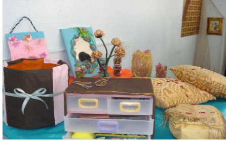
علبة مناديل وخدديات وسلة مهملات مجملين بالأقمشة متنوعة الخامة، ومقلمة وادراج بلاستيك