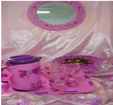
مرأة مجملة بالستان والورد - كاسات مزخرفة بألوان الزجاج - وعاء بلاستيك للمياه مجمل بالستان وزينة الملونة ويمكن فكة وتركيبه.