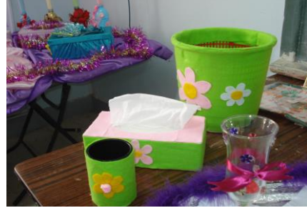
علبة مناديل و سلة مهملات ومقلمة مجملة بالوق المقوى الملون وبقاقي الاقمشة