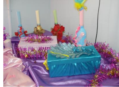
علب مناديل مجمل بالستان والزينة الملونة، وشموع داخل زجاجات ملونة ومجملة بالورد