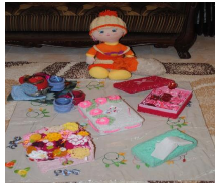
مفرش من القماش مطرز بغرز التطريز - علبة مناديل مجملة بالأقمشة الملونة وورد الكروشيه - علب تصلح لتخزين الخيط أو أي أغراض مجملة بالقماش وورد الكروشيه - عروسة أطفال بملابس الكروشيه