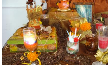
تجميل كاسات المياة وعلب المناديل بالورود الصناعية والخيش