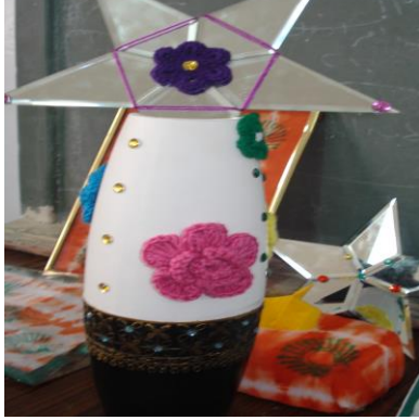
فازة بلاستيك مجملة بالخرز وورد الكروشيه