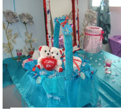
علبة مناديل مجملة بالثل ودب صغير -