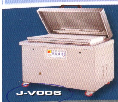
الشكل (1): مكيئة التعبئة تحت التفريغ لعبوات البولي اميد / بولي إيثيلين وعبوات البولي إيثيلين

ثالثاً: تخزن الـ 18 عينة المعدة في الخطوة الأولى بالتجميد على درجة -18 م وتحلل شهريا إلى أن ترفض آخر عينة حسيا عن طريق التقييم الحسي للرائحة فقط (هل هي طبيعية ومقبولة أم غير طبيعية وغير مقبولة).